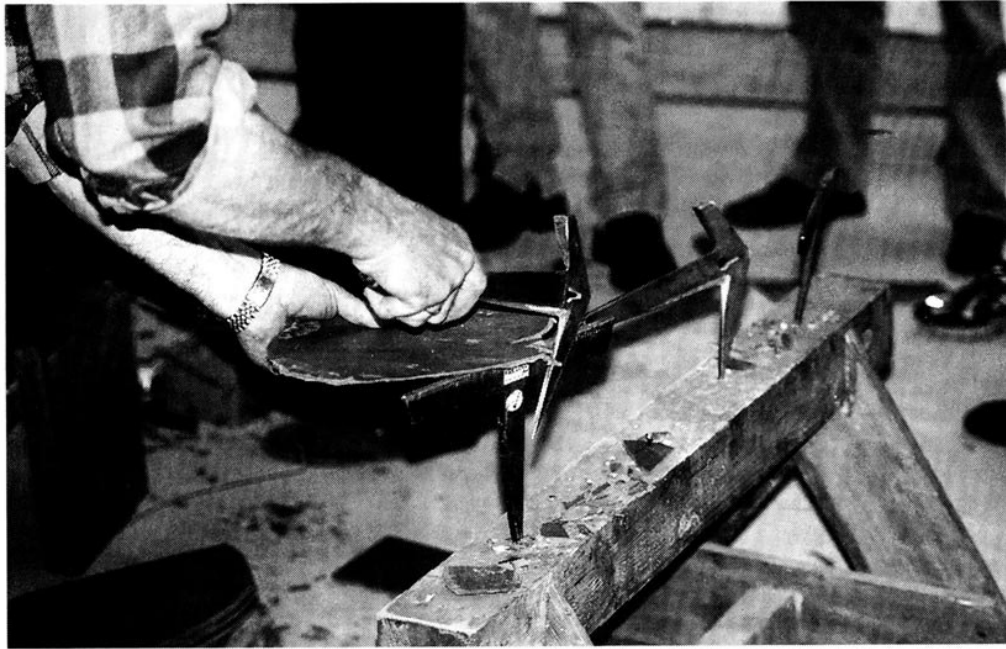
Przycinanie płytki Struktonitu

kilka sposobów, co w efekcie końcowym daje wrażenie harmonii, lekkości i elegancji. Trudno jest tutaj stosować gotowe wzorce, bowiem każdy dach jest niepowtarzalny.