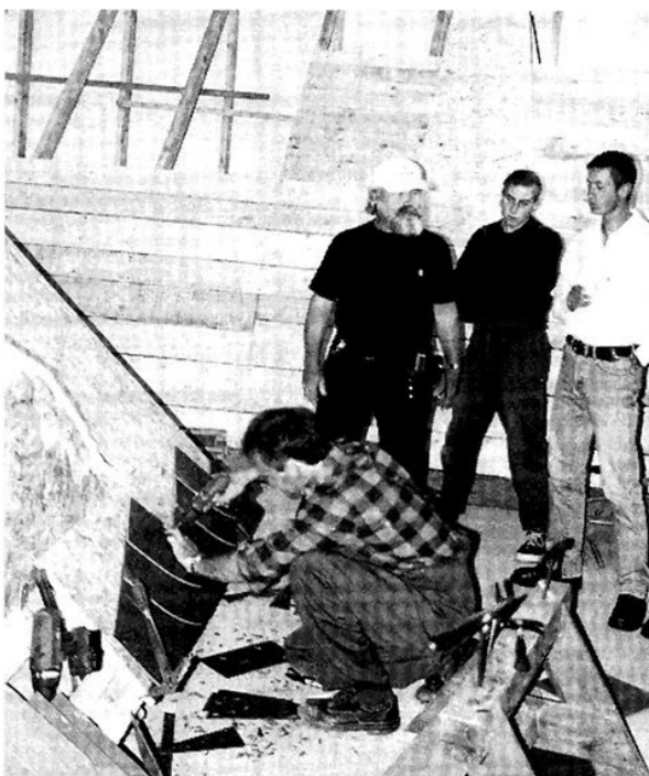
Układanie płytek Struktonit

Płytki Struktonit to produkt w Polsce mało znany. Surowcami do jego produkcji są m. in. cement oraz organiczne włókna celulozowe. Płytkę może posiadać dwa rodzaje powierzchni licowych – gładką oraz o strukturze łupka naturalnego. Dostępna jest w czterech kolorach standardowych (z możliwością zamówienia kolorów dodatkowych). Kształt i wielkość płytek jest uzależniona od sposobu zastosowania tego materiału w sztuce dekarskiej.