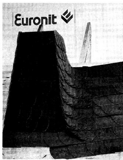
Pokrycie ścianek komina

Związany z koncernem Etex Group Euronit jest firmą z ponad 70-letnią tradycją, działającą w całej branży budowlanej, lecz koncentrującą się szczególnie na sektorze pokryć dachowych. Fabryka dachówek cementowych Euronit i siedziba polskiego oddziału firmy znajduje się w Olkuszcu. Oprócz dachówek Euronit produkuje płytki dachówkowe o nazwie Struktonit. Właśnie temu produktowi poświęcone było szkolenie w ramach „Warsztatów dekarских”.