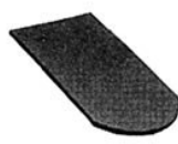
Rys. 11. Dachówka 5/4