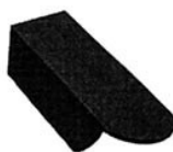
Rys. 13. Szczytowa 3/4 i 5/4