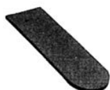
Rys. 10. Dachówka 3/4