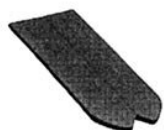
Rys. 9. Dachówka 1/2